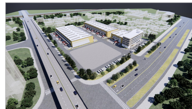
规划经济指标一览表